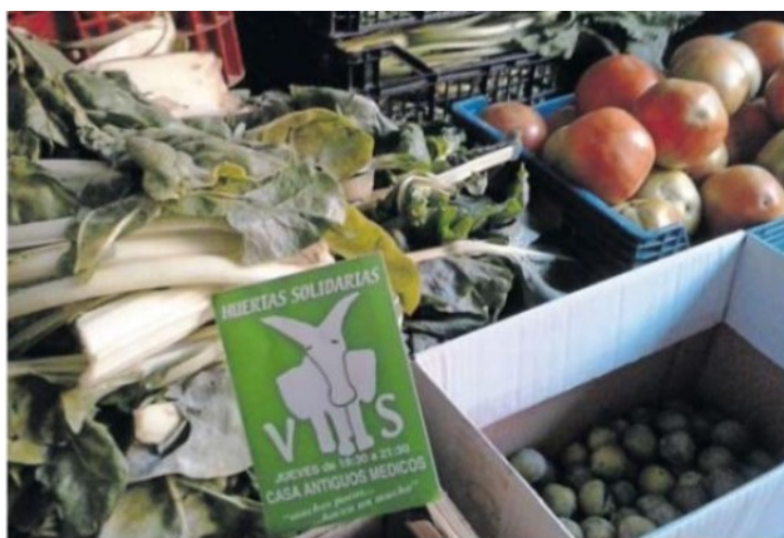
* Producto fresco recogido por las Huertas Solidarias de Sangüesa en su local.

7.-Una alianza importante acometida este año ha sido con las "Huertas Solidarias de Sangüesa". Hemos empezado a recibir sus productos junto a Paris 365 y la Fundación Xilema. Este año nos han entregado 1.083 kilos de Verdura Fresca principalmente en los meses de Julio-Agosto y Setiembre.